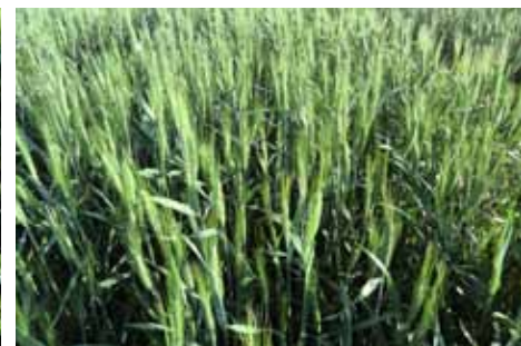
Изреженность стеблестоя на делянке с ламадором (слева) и достаточная густота на варианте ламадор+круизер (справа)