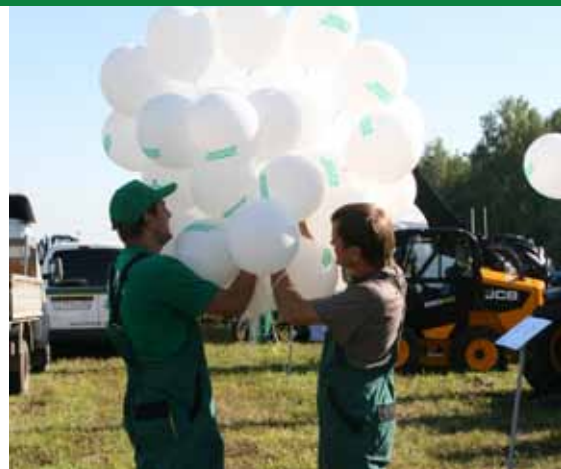
...над полями Рязанщины