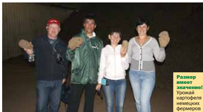
Размер имеет значение! Урожай картофеля немецких фермеров