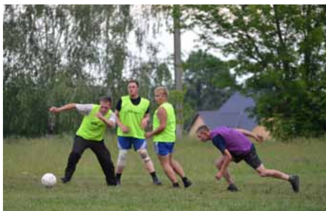
Агрономы «Защитного» уверенно чувствуют себя и на футбольном поле