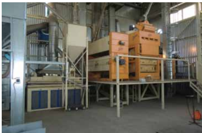
Семенная линия «ЭкоНивы» в ООО «Защитное»

позитивно отражается на весеннем отрастании;